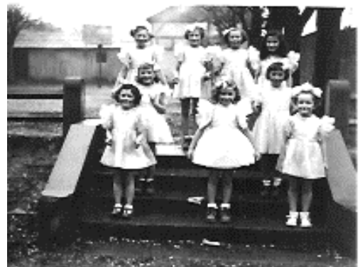
Le ballet des poupées - 1952

Dans les années qui suivirent la construction de l'Eglise, les kermesses et les spectacles avaient pour but de récupérer de l'argent pour la confection des transepts, pour les vitraux, pour la maison des soeurs (25 rue de Jouvence), puis ce fut pour la colonie de vacances de Saint Lupicin (acquisition, aménagement, entretien...) et les oeuvres paroissiales. La troupe théâtrale des années 1930 jouait à l'époque des "drames" ou "mystères" avec acteurs, musiciens, chanteurs : la grande pastorale de Noël (50 acteurs, 50 musiciens et chanteurs) l'Enfance de Jésus, ( 80 personnages, 60 choristes et musiciens) Le Pauvre d'Assise, Jeanne d'Arc... etc.