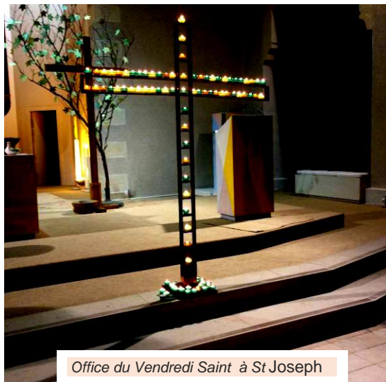
Office du Vendredi Saint à St Joseph