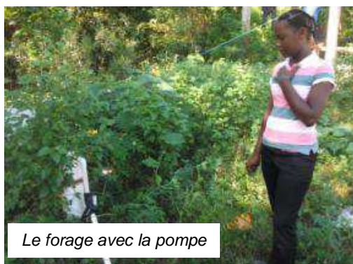
Le forage avec la pompe