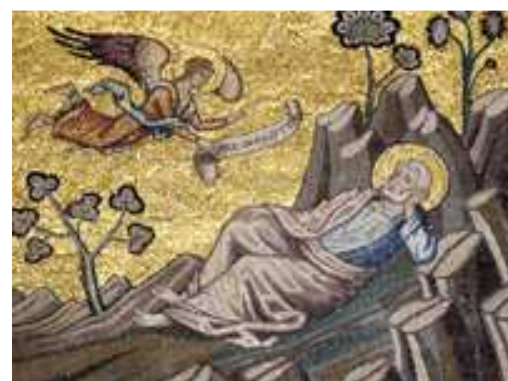
Ernest Hello, 1875

Le silence est sa louange, son génie, son atmosphère. Son silence ressemble à un hommage rendu à l'inexprimable. C'est l'abdication du bavardage, de l'étalage et du bruit devant l'insondable et devant l'Immense.