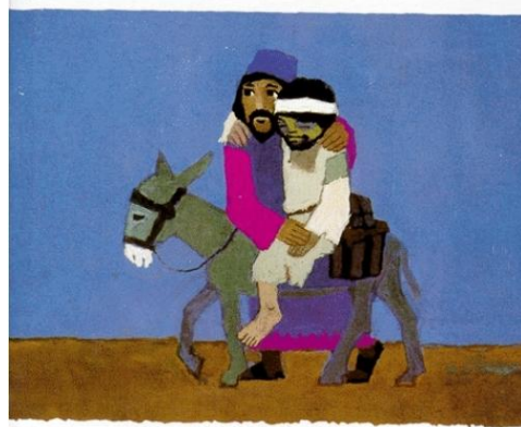
Le bon Samaritain

13 et 14 juillet 2019 15 ème dimanche De l'ordinaire